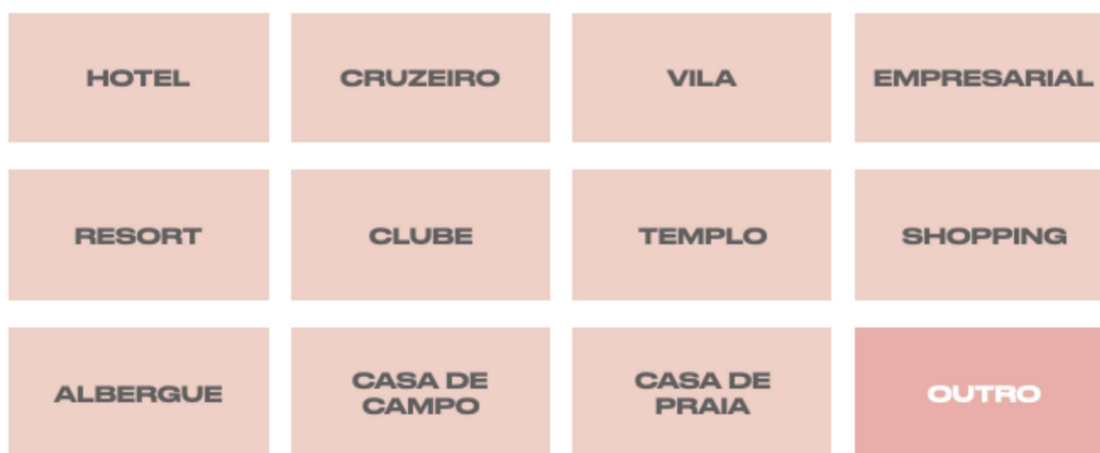
Figura 2: Metáforas de moradia estimuladas em dinâmica.

A dinâmica de escolha ser de no mínimo duas metáforas foi estabelecida após experimentos realizados em Cavalcanti (2020), que demonstraram uma tendência a certos padrões de escolha na primeira metáfora entre perfis de participantes muito diferentes. A partir disso, viu-se que ao escolher mais de uma metáfora, os participantes traziam atributos e outras dimensões mais abrangentes, sendo possível identificar expectativas e seus mitos associados. Nesse processo, observamos desejos de moradia como possibilidade de socialização para quem escolheu “clube”, ou mesmo uma certa expectativa mandatória de ter privacidade a partir da mesma metáfora, através da ideia de clube com apenas amigos. Além de perfis que desejavam uma comodidade de serviços de um “cruzeiro” para moradia, ou que supunham que caso morassem como numa “vila”, com amigos próximos, teriam uma relação ótima de convivência. Tudo isso, permite destacar alguns aprendizados: