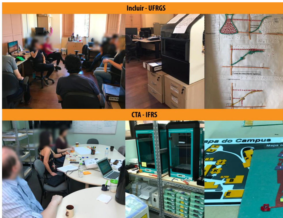
Figura 2: Núcleos de Acessibilidade da UFRGS e da IFRS..

apresenta as estruturas físicas, equipes e gráficos instrucionais táteis criados pelos Núcleos Incluir e CTA.