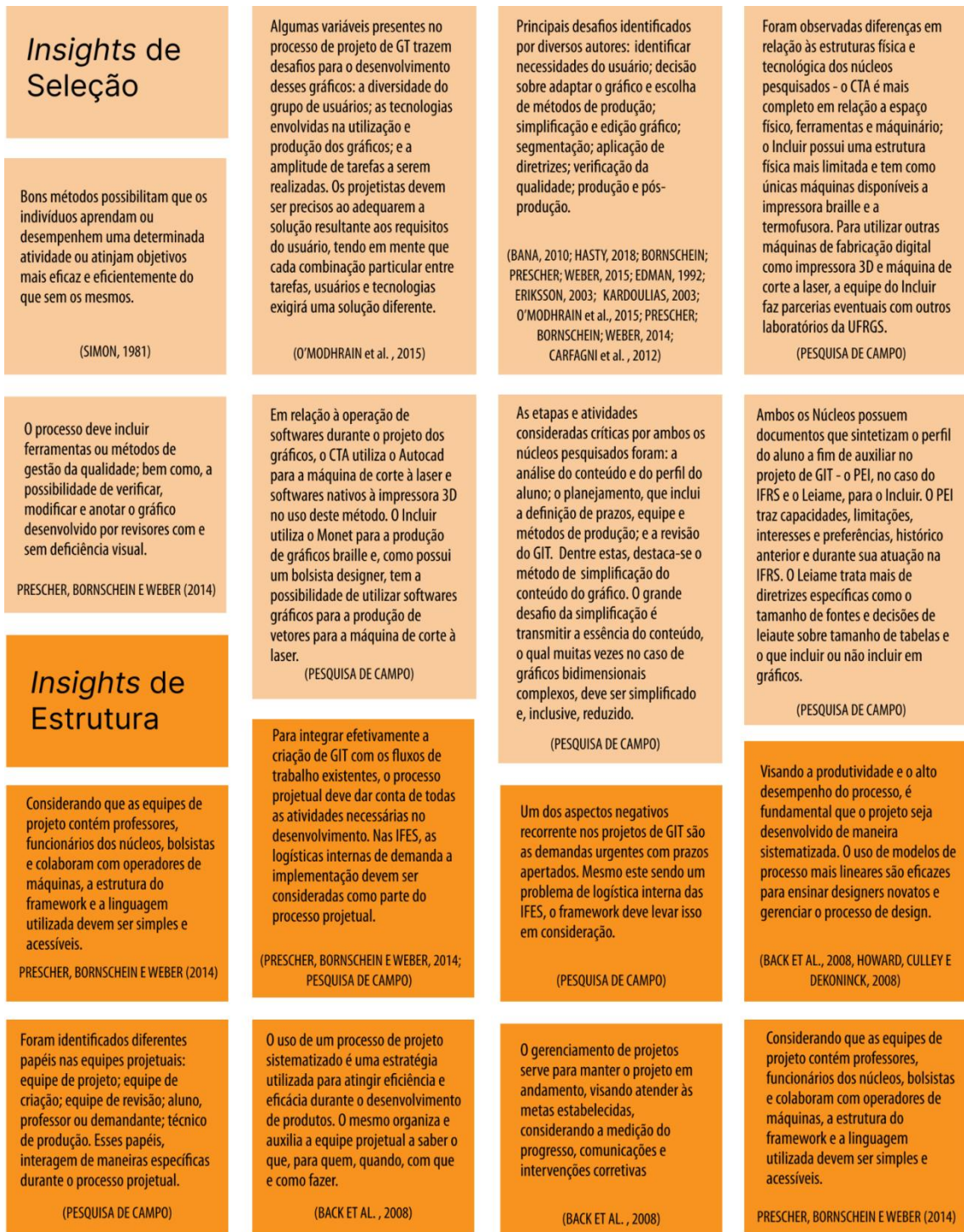
Figura 3: Insights para a elaboração dos critérios para o Framework.

Os insights levantados foram padronizados em 20 critérios preliminares, segundo o método de padronização de Back et al. (2008), no qual o objeto a ser padronizado – neste caso, os critérios projetuais – é caracterizado conforme uma sintaxe comum e relevante ao propósito em questão. Foram atribuídas duas sintaxes possíveis para os critérios: