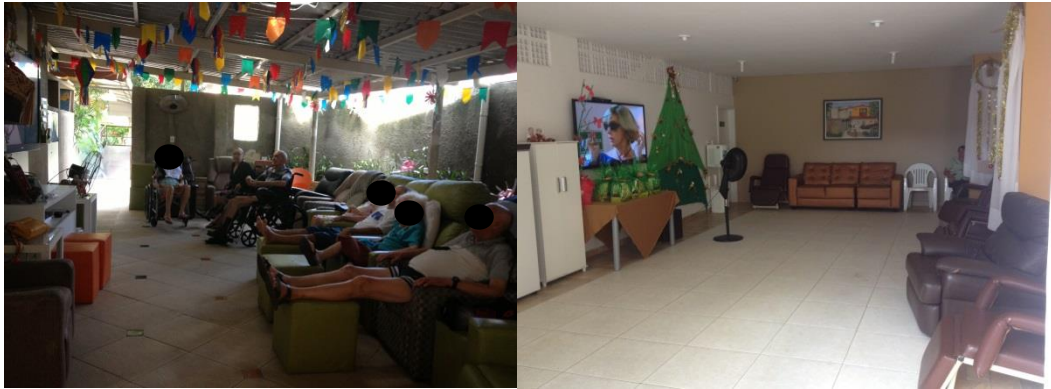
Figura 4: Áreas de convivência dos dois blocos.

As áreas de convivência são utilizadas pelos idosos de acordo com o Bloco correspondente aos seus quartos, onde costumam assistir televisão. Porém a área do Bloco A é a mais utilizada, ocorrendo nela atividades de lazer, culturais, bem como o atendimento da fisioterapia e terapia ocupacional, quando estes não são realizados no próprio quarto. Portanto, fica a área de convivência do Bloco B subutilizada, apesar de ser mais ventilada e iluminada, além de existência de mobiliário novo. Contudo, essa preferência deve estar relacionada ao fato de ser no Bloco A as instalações de infraestrutura e administrativa - cozinha, administração, enfermaria e recepção da casa, que são de uso comum aos dois Blocos.