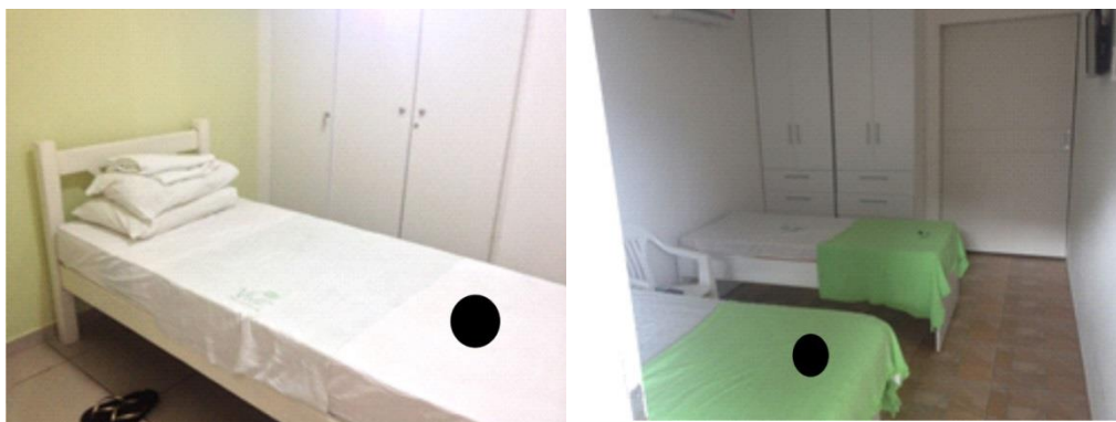
Figura 5: Exemplo de quartos individuais e duplos da Casa

Os quartos, individuais ou com duas camas (Figura 5), e que acomodam idosos do mesmo sexo, têm espaços reduzidos, iluminação deficiente, e ruídos externos que interferem no conforto dos ambientes. Nesta mesma casa encontram-se áreas adaptadas para finalidade de hospedagem de idosos e ambientes projetados para esse fim, porém em nenhuma das duas situações foi encontrado o atendimento às normas vigentes quanto ao dimensionamento, acústica, conforto ambiental - térmico e lumínico.