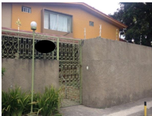
Figura 3: Fachada da Casa

O estudo de caso desta pesquisa foi uma casa de longa permanência para idosos (ILPI) de natureza particular localizada na cidade do Recife, Pernambuco, com área de 313,70m 2 , cuja proprietária é a administradora. Foi considerada uma instituição de alto padrão devido ao valor pago pelos idosos e/ou seus familiares, por volta de 6 (seis) salários mínimos (vigente em 2014) para acomodações individuais e de aproximadamente 4,5 salários por pessoa para acomodações duplas. Apresenta fachada da entrada preservada com a arquitetura da residência (Figura 3) que deu espaço ao Bloco A da ILPI, e posteriormente o terreno foi aproveitado para a segunda etapa da casa. A placa de identificação da instituição é discreta, composta por dois portões, sendo um na entrada principal e outro maior de serviços e movimentação de cargas.