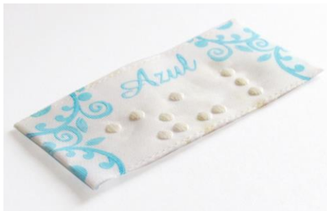
Figura 5: Etiqueta Têxtil em braille – ETQ-01

largura por 24,0 mm de altura, confeccionada em tecido, com os pontos em braille bordados, formando a palavra “Azul” (cf. Figura 5).