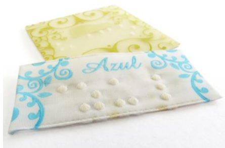
Figura 4: Exemplos de etiquetas têxteis em braille da empresa Alpha Fonte: Elaborado pelos autores, 2016.

A forma de criação dos pontos do braille, assim como as informações a serem colocadas nas etiquetas, fica a critério dos desejos e necessidades de cada cliente 9 . Se for uma etiqueta tecida, os pontos do braille são realizados por meio de um bordado elevado, se a etiqueta for de papel/tecido ou qualquer material flexível é feito um molde em chapa metálica que é repassado para a etiqueta por meio de uma prensa térmica. A empresa salienta a necessidade de reduzir a quantidade de informação em braille a ser colocada na etiqueta, devido ao pouco espaço. Normalmente, as principais informações inseridas em braille dizem respeito à cor e ao tamanho. Dois exemplos de etiquetas têxteis em braille podem ser observados na Figura 4, a seguir.