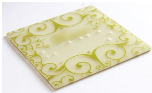
Figura 6: Etiqueta têxtil em braille – ETQ-02

A amostra de deficientes visuais foi selecionada por conveniência e por julgamento da Gerente Técnica da ACIC, de acordo com a disponibilidade do indivíduo em participar e discutir os pontos abordados na entrevista, assim como, a capacidade de realizar o teste. Todos os voluntários foram entrevistados individualmente, em espaço reservado e fechado, para evitar quaisquer constrangimentos. Todos os entrevistados estavam cientes e concordaram verbalmente com realização da pesquisa e a coleta dos dados necessários.