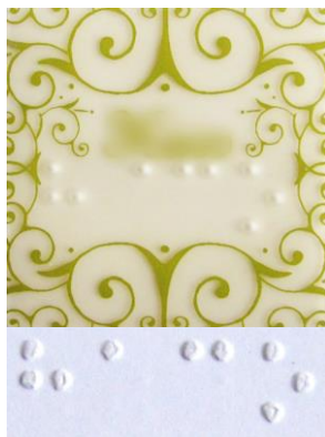
Figura 7: Comparação entre as distâncias dos pontos do braille

Percebe-se que não só a distância entre os pontos do braille são diferentes, como o tamanho e formato do ponto em si também diferem dos pontos apresentados em papel. Nota-se que o ponto representativo da letra “A” (segunda letra da etiqueta) está muito mais afastado dos pontos da primeira letra do que os pontos da terceira letra. Parece não haver nenhuma lógica regular no posicionamento dos pontos presentes na etiqueta ETQ-02.