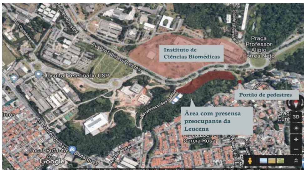
Imagem 3: Área de maior infestação e coleta das amostras na Cidade Universitária.

As tabelas 2 e 3 mostram características biológicas e tecnológicas da árvore de leucena, sendo possível observar algumas informações conflitantes, provavelmente pela diversidade das fontes, que diferem tanto em data da publicação (de 1980 até 2017) quanto nas localidades dos estudos realizados (África, Oriente Médio, América Central e América Latina).