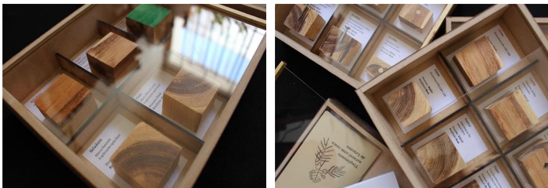
Imagens 5 e 6: fotografias do Painel de Trabalhabilidade finalizado.