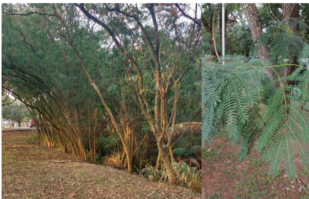
Imagens 1 e 2: Leucena na Cidade Universitária.

...de rápido crescimento, fixadora de nitrogênio, usada para produção de forragem, reflorestamento e proteção contra o vento, (...) que foi introduzida em muitas localidades por suas qualidades, mas tem se tornado uma invasora agressiva em zonas tropicais e subtropicais e é listada como uma das 100 espécies invasoras mais perigosas. Essa árvore sem espinhos pode formar uma comunidade densa e monoespecífica que é difícil de ser erradicada uma vez estabelecida. Ela torna áreas extensas inutilizáveis e inacessíveis, ameaçando plantas nativas. (ISSG, s.d.)